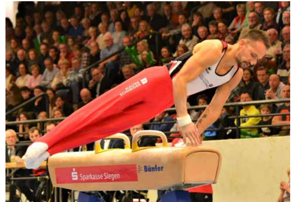
Volle Hallen wie hier beim Wettkampf SKV – SC Cottbus im November 2019 wird es diesmal aller Voraussicht nach nicht geben.

Einen ähnlichen Modus wird es auch für 2021 geben. Es steht schon fest, dass die 1. Liga dann zehn Mannschaften umfassen wird, weil es 2020 zwei Aufsteiger aus den 2. Ligen gibt, aber keinen Absteiger. Dafür wird es dann drei Absteiger in 2021 geben, um wieder auf acht Erstligisten zu kommen. Termine sind noch nicht bekannt – es wird auch 2021 alles davon abhängen, ob die Olympischen Spiele stattfinden werden und welche weiteren internationalen Großereignisse ausgetragen werden können.,,