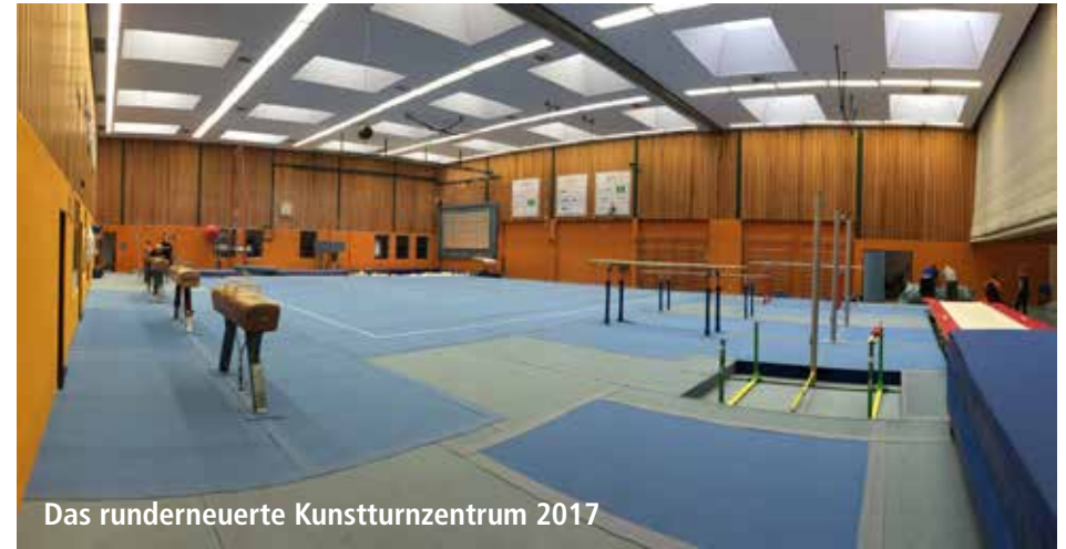
Das runderneuerte Kunstturnzentrum 2017