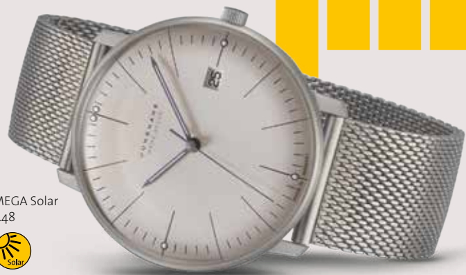
max bill MEGA Solar 059/2022.48