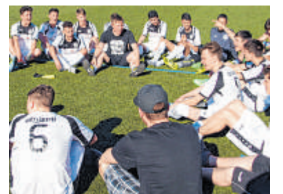
Die B-Junioren des VfL Klafeld Geisweid sind mit einem Sieg im Heimspiel gegen die FSV Werdohl in die Bezirksliga aufgestiegen.

Ähnlich ist die Ausgangsposition für die D-Junioren der SG Siegen-Giersberg. Auch die SG wäre mit einem Sieg am „Sender“ gegen den SC Lüdenscheid sicher in die Bezirksliga aufgestiegen. Zwar hat die Mannschaft von Jochen Haardt drei Punkte Rückstand auf den SCL und das schlechtere Torverhältnis, da jedoch zuerst der direkte Vergleich angewendet wird, stünde Giersberg mit sieben Zählern hinter dem SV Hüsten als zweiter Aufsteiger fest. Spielbeginn ist am Samstag um 13.30 Uhr.